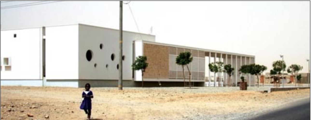
Centre d'urgence pédiatrique à Port Soudan, Studio Tamassociati Architectes, lauréats du Prix des jeunes architectes italiens