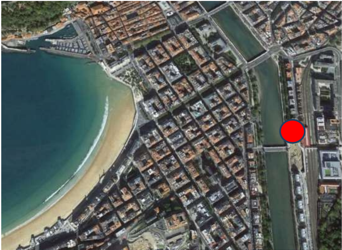
9:00 horas: COAVN Gipuzkoa. Paseo de Francia