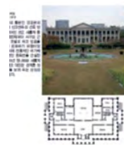
Seúl, Corea del Sur. El Ayuntamiento de Seúl ha publicado una guía arquitectónica y urbanística de la ciudad con el fin de facilitar el acceso de los ciudadanos y de los turistas a los sitios más emblemáticos de la capital además de familiarizarlos con su historia arquitectónica y urbana. Incluye la descripción de 380 edificios tradicionales y contemporáneos, clasificados por épocas y zonas de ubicación. La publicación, que también recoge diez itinerarios temáticos culturales, es ya todo un éxito entre los habitantes de esta ciudad. La municipalidad prevé su publicación en varios idiomas como parte de la organización del Congreso de la UIA que tendrá lugar en Seúl en 2017 bajo el lema: El Alma de la Ciudad.