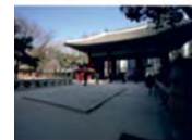
Seúl, Corea del Sur. El Ayuntamiento de Seúl ha publicado una guía arquitectónica y urbanística de la ciudad con el fin de facilitar el acceso de los ciudadanos y de los turistas a los sitios más emblemáticos de la capital además de familiarizarlos con su historia arquitectónica y urbana. Incluye la descripción de 380 edificios tradicionales y contemporáneos, clasificados por épocas y zonas de ubicación. La publicación, que también recoge diez itinerarios temáticos culturales, es ya todo un éxito entre los habitantes de esta ciudad. La municipalidad prevé su publicación en varios idiomas como parte de la organización del Congreso de la UIA que tendrá lugar en Seúl en 2017 bajo el lema: El Alma de la Ciudad.