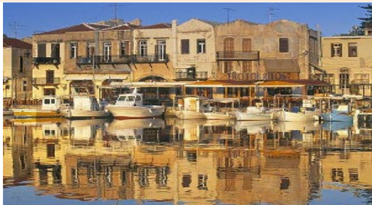
CRETA : AGHIOS NIKOLAOS