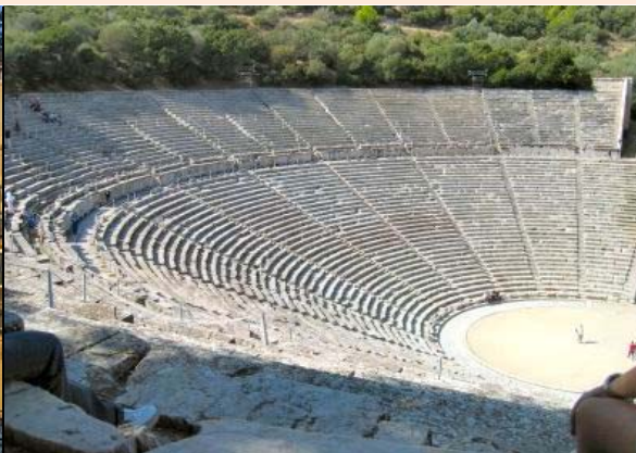
EPIDAURO : EL TEATRO PERFECTO