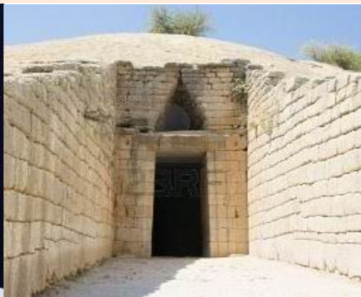
TUMBA EN MICENAS