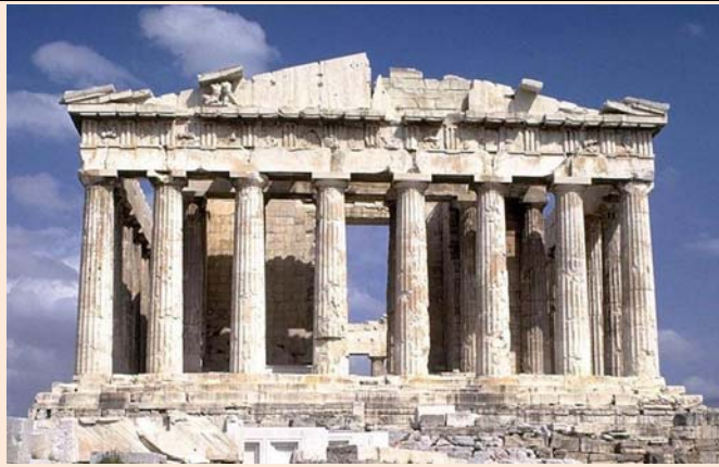
ATENAS : PARTENÓN