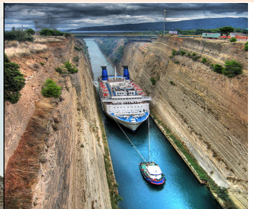
CANAL DE CORINTO