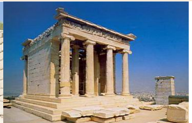
TEMPLO DE VICTORIA NIKÉ