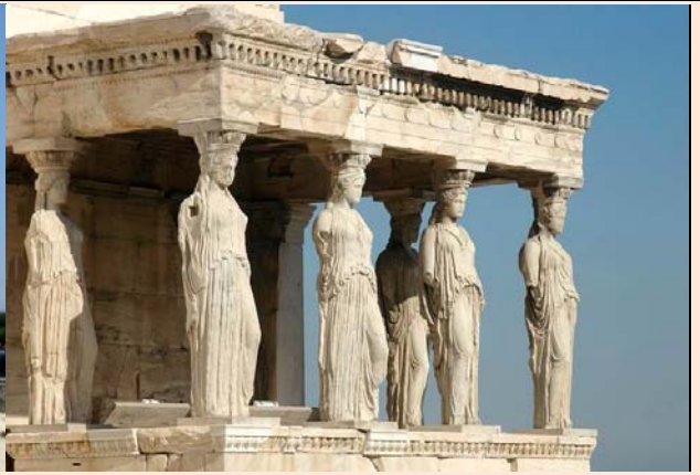
ATENAS : ERECTHEIÓN