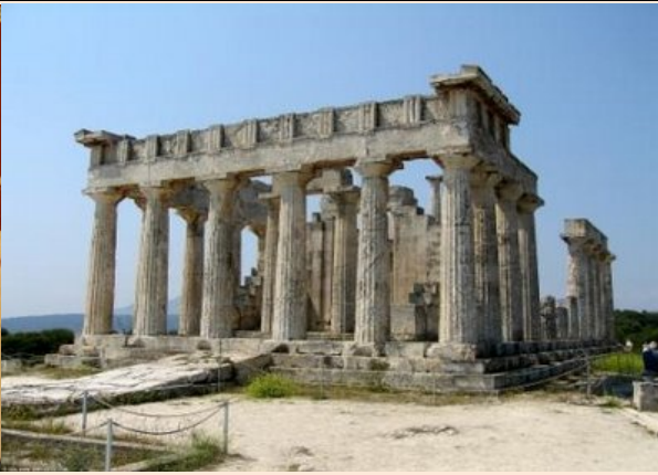
EGINA : TEMPLO DE APHAIA