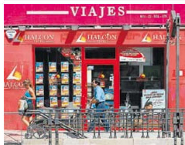
Polémica por la liberalización de servicios. Á. NAVARRETE

En la subida de la tasa de morosidad también está influyendo el parón de la concesión de créditos. En marzo, el saldo vivo de financiación concedida a empresas y hogares era inferior a la de un año antes, una situación que no se vivía desde el 2000. *