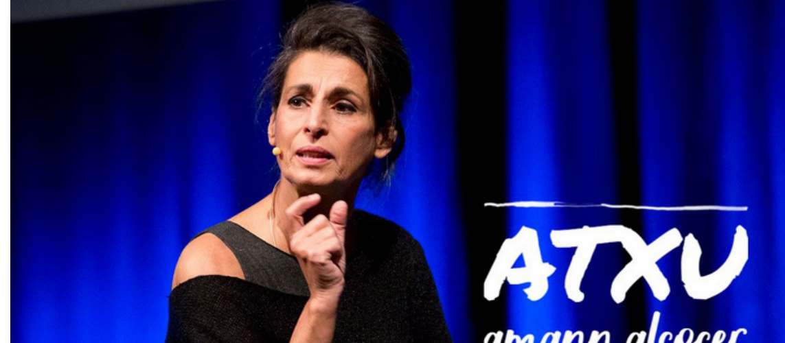
HITZALDIA / CONFERENCIA: