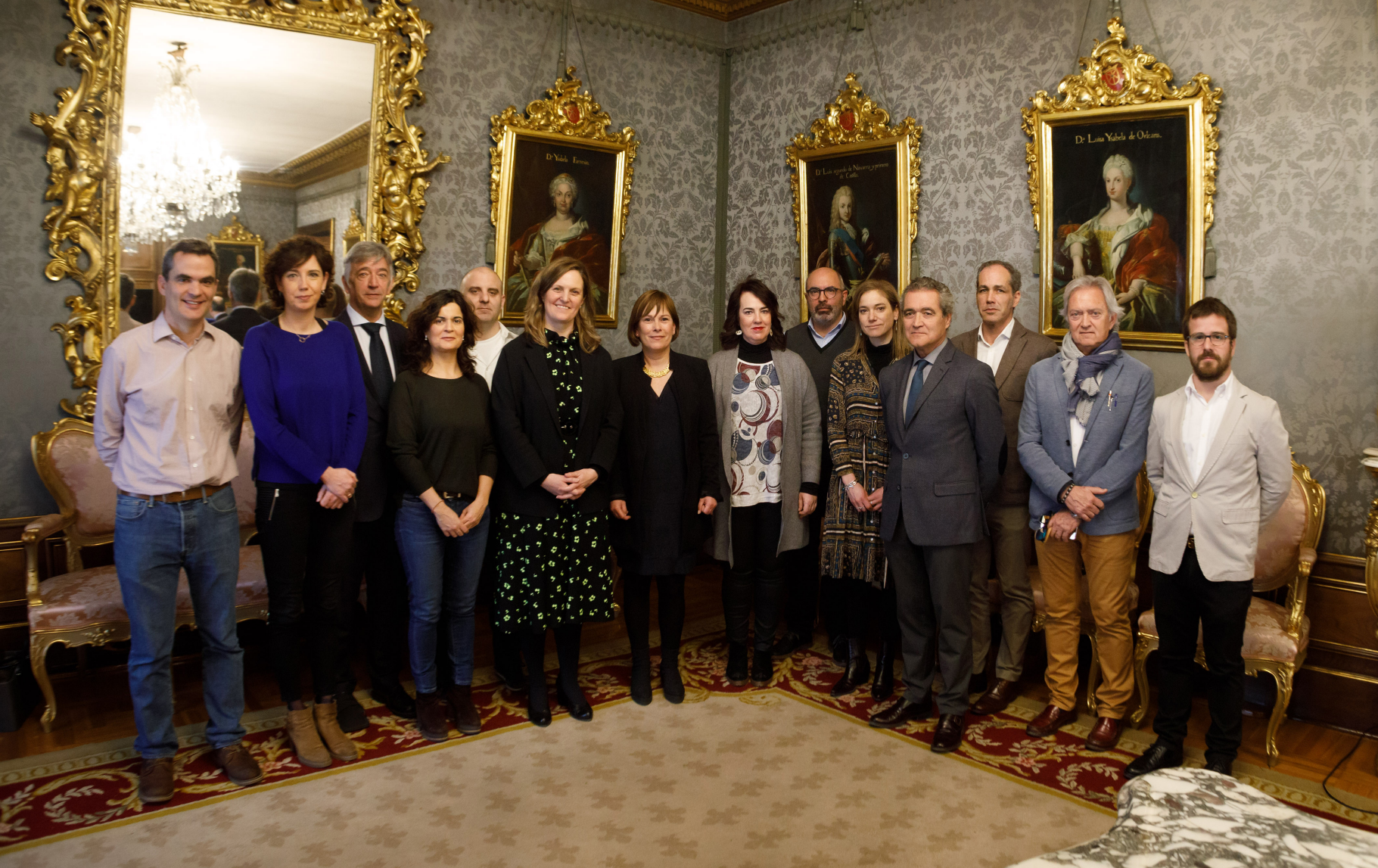
Acto de firma del Gobierno de Navarra y el Parlamento de Navarra el 4 de marzo de 2019 Nafarroako Gobernuaren eta Nafarroako Parlamentuaren sinadura-ekitaldia, 2019ko martxoaren 4an