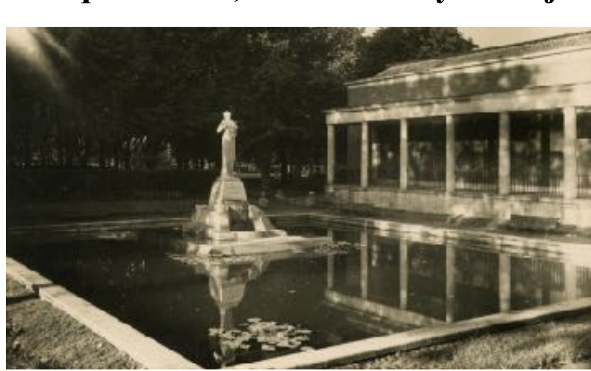
2020ko Arkitekturaren Nazioarteko eguna / Día Mundial de la Arquitectura 2020

Arkitektura, Ondaera eta Paisaia Arquitectura, Patrimonio y Paisaje