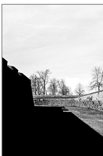
ACCÉSIT. 'Equilibrio' Autor: Eduardo Dipré