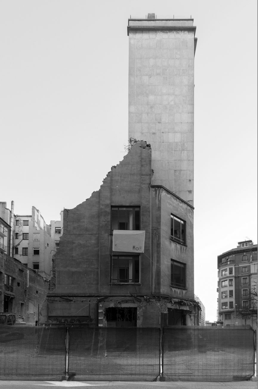
PRIMER PREMIO-LEHEN SARIA. 'Arquitectura de cine' Autor: Koldo Fernández Gaztelu