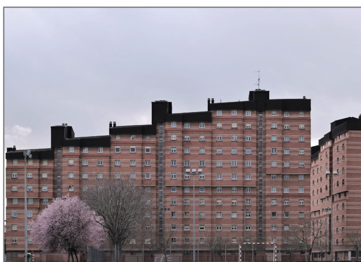
ACCÉSIT. 'En consonancia' Autora: Karmele Sáenz Irigoyen