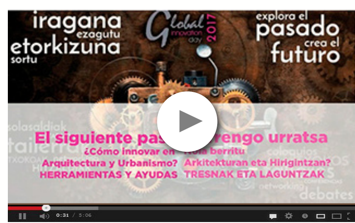
Vídeo de la Jornada Jardunaldiaren bideoa

Bere interesagaitik, Jardunaldiaren bideoaren eta hitzlariek, bere zabalkunderako, emandako materialeen estekak bidaltzen ditugu.