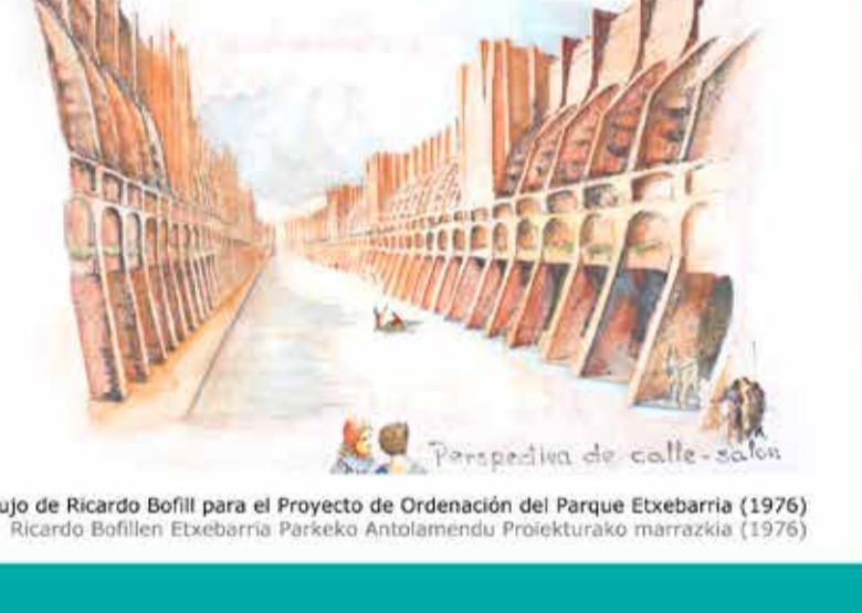
Dibujo de Ricardo Bofill para el Proyecto de Ordenación del Parque Etxebarria (1976) Ricardo Bofill en Etxebarria Parkeko Antolamendu Proiekturako marrazkia (1976)