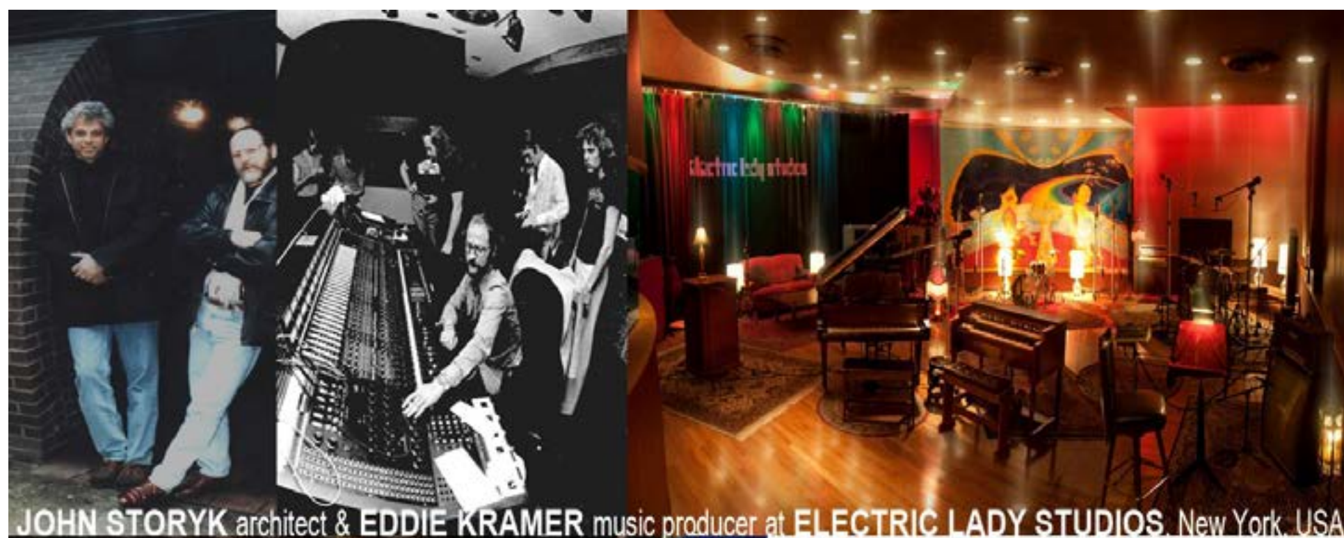
JOHN STORYK architect & EDDIE KRAMER music producer at ELECTRIC LADY STUDIOS, New York, USA