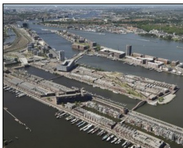
Muelles del Este. . Amsterdam