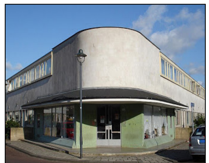
Barrio Kiefhoek. Rotterdam (1930)