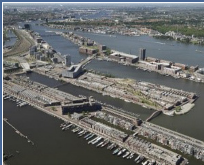
Muelles del Este. . Amsterdam