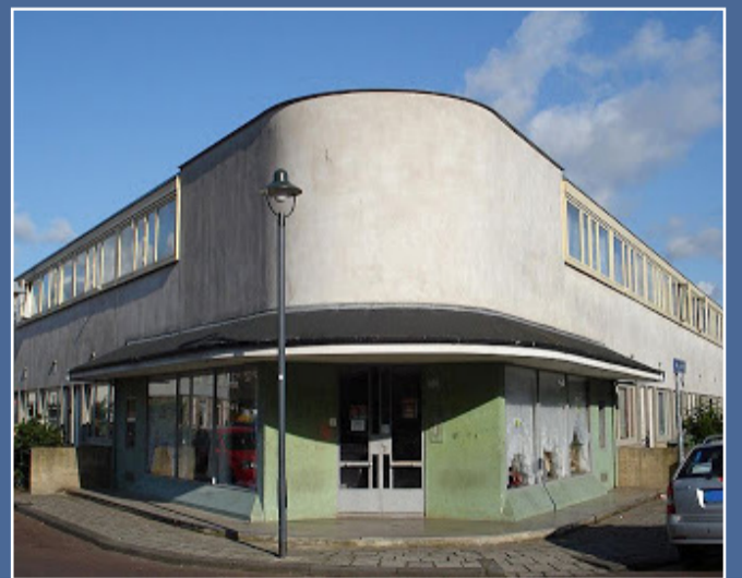
Barrio Kiefhoek. Rotterdam (1930)

Amsterdam está bien comunicada con Bilbao por vía aérea, ya que las compañías KLM y Vueling, ofrecen vuelos directos desde Loiu. La idea es que haya un autobús disponible para todos los viajeros desde el momento en que el avión que saldrá de Bilbao llegue a Amsterdam. En el caso del viaje gestionado por la A.V.N.A.U., el horario del vuelo (con KLM) será, con toda probabilidad, de 17:30 a 19:40. El citado autobús estará disponible hasta la hora de embarque del vuelo de vuelta. Os recordamos que el día de la vuelta coincide con las elecciones municipales y forales, y el horario del vuelo será de 14:50 a 16:55, con toda probabilidad.