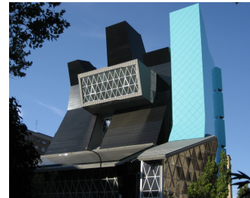
Fachadas Ventiladas A1

B) Soluciones adaptadas al CTE: seguridad con eliminación de puentes térmicos.