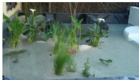
Nuevas soluciones de piscinas naturalizadas y cubiertas aljibe ajardinadas con EPDM