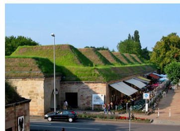
Cubiertas Ajardinadas de Formas Particulares

Cada presentación se sigue por un turno de preguntas