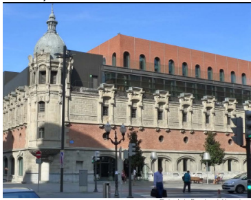
Ligereza y Seguridad en cubiertas metálicas