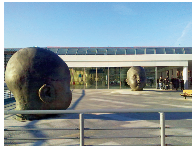
Elevada Resistencia a la Compresión