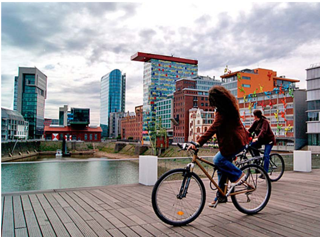
Mediahafen - Düsseldorf