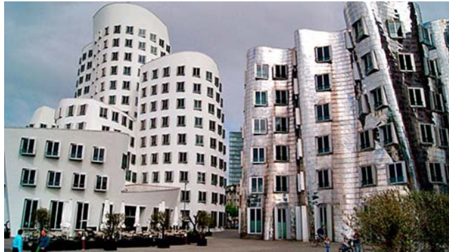
Neuer Zollhof - Düsseldorf