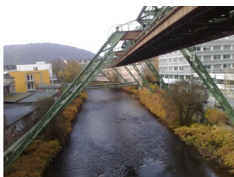
Monorail de Wupertal