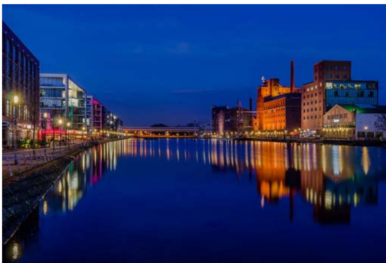
Innenhafen - Duisburg