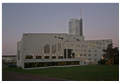
Teatro Alvar Aalto