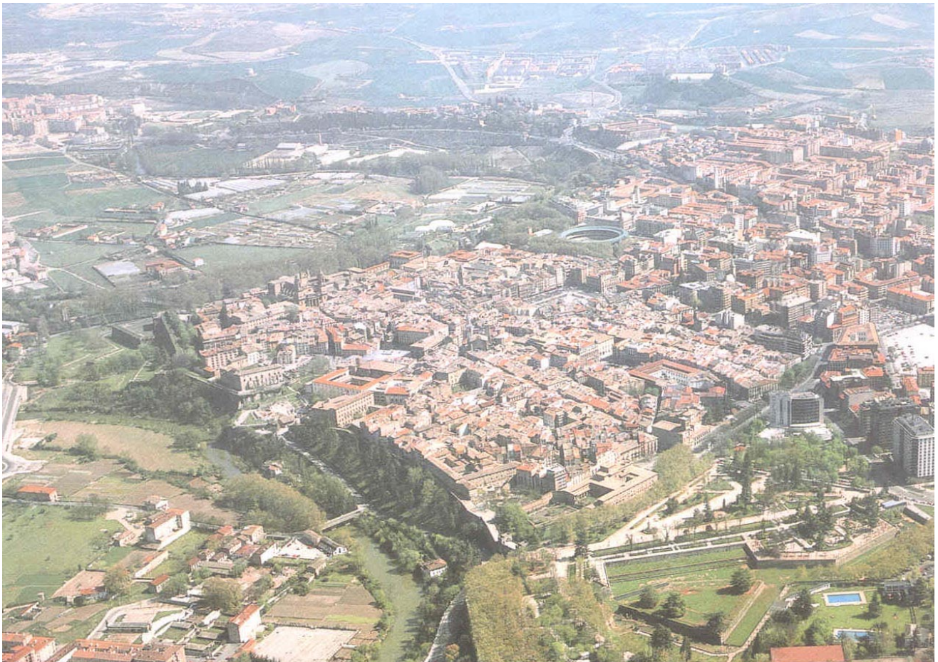
Vista aérea de Pamplona con el Casco Histórico en primer término

Aunque resulte comprensible la preocupación de nuestros ediles por conseguir medios con los que afrontar los múltiples cometidos sociales de su responsabilidad, esa conducta puede generar desgraciadas e irreversibles consecuencias para el futuro de la ciudad. Además, se introduce una dinámica de enfrentamiento y competitividad entre Ayuntamientos, olvidando que la ciudad no debe ser una mercancía y que el urbanismo cumple una función pública fundamental para regular y organizar políticamente el desarrollo urbano.