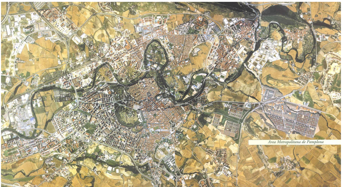
Ortofoto del Área Metropolitana de Pamplona

Buena parte de esos núcleos disponen de una administración propia con competencias de extraordinario vigor en materia de planificación urbana. En función de esa capacidad, el planeamiento local de los Municipios aledaños a la ciudad central ha ido resolviendo directamente los problemas urbanísticos de las distintas entidades, superando las deficiencias originadas en los años del desarrollismo no planificado, y afrontando con cierta habilidad los conflictos propios de cada núcleo en relación a la regeneración del tejido urbano, planificación del desarrollo, previsión y ejecución de equipamientos, reserva para espacios libres de carácter local, etc. Todo ello, desde un ámbito de decisión muy próximo al tejido social y por lo tanto, mediante una vinculación directa con la población afectada. La favorable experiencia de este modo de actuar debe ser considerada ante cualquier propuesta de modificación del mapa de competencias en asuntos de urbanismo.