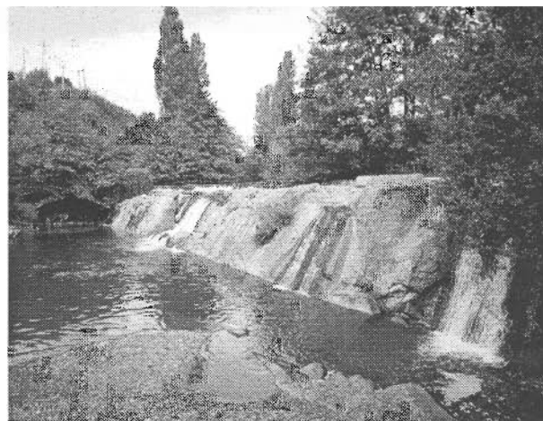
Vistas de diversos tramos del río

Otro de los objetivos es considerar los problemas relacionados con inundaciones en tramos urbanos y las medidas necesarias, si bien se asume que ciertas avenidas extraordinarias podrán alcanzar a terrenos agrícolas y al propio parque.