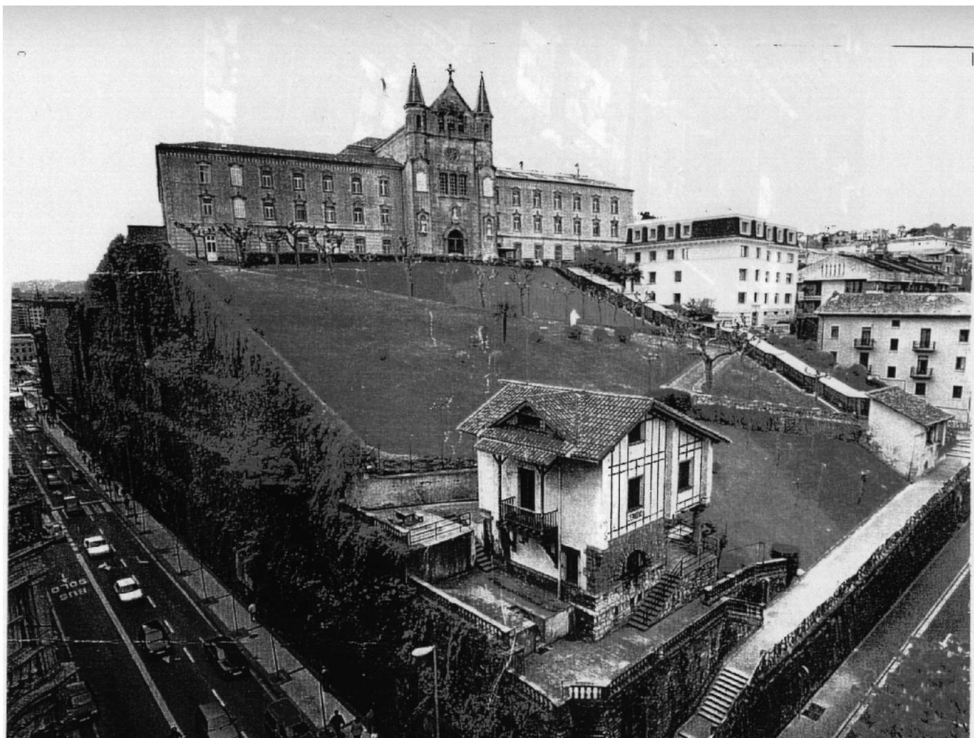
Vista de la ladera Norte del Cerro de San Bartolomé, con el Convento y el Muro.

de la misma) para reclamar la reconsideración del proyecto, la convocatoria de un concurso de ideas de ordenación , e incluso el referendun ciudadano que con ánimo electoralista fue ofrecido en su día por la Alcaldía