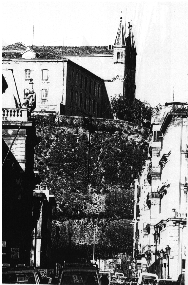
Vista desde el Ensanche del Muro y del convento

Sálvese el cerro de San Bartolomé. Se nos agradecerá